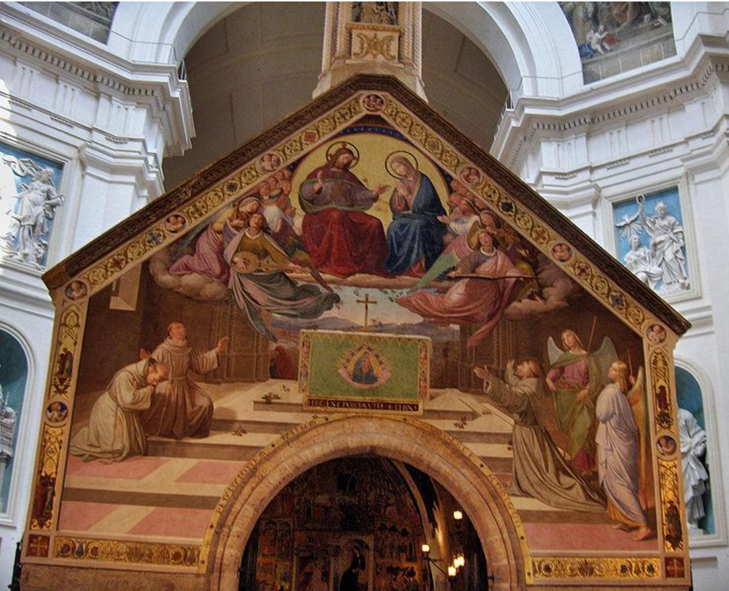
Overbeck, affresco sulla facciata della Porziuncola, 1829, Assisi, Santa Maria degli Angeli