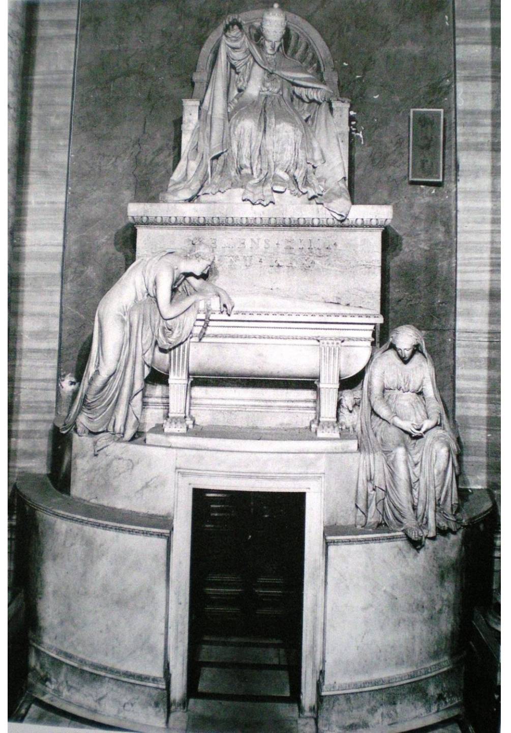
Canova, Tomba Clemente XIV, Ganganelli, 1783-87 Santi Apostoli