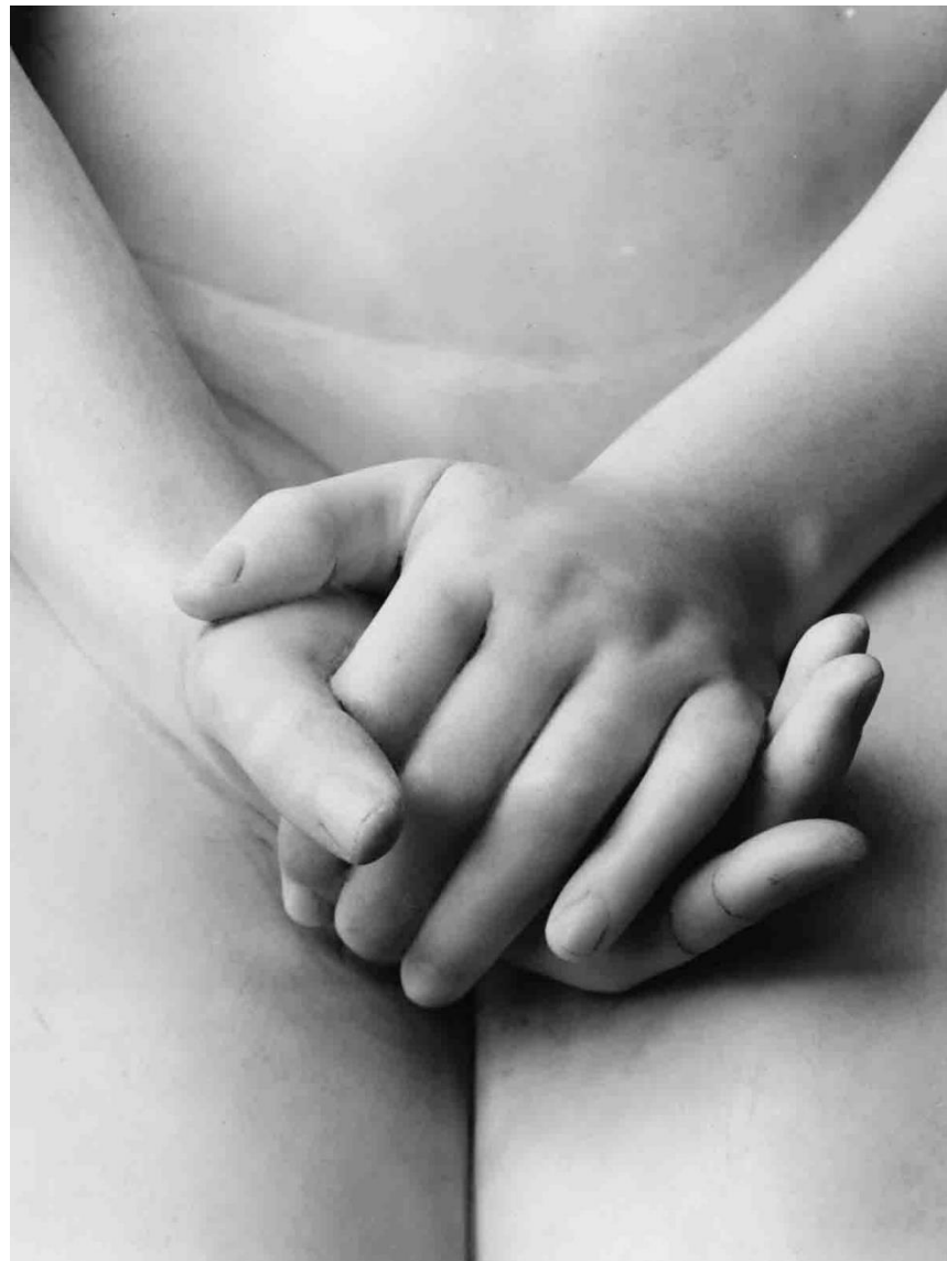
La Fiducia in Dio, 1833 Milano, Poldi Pezzoli