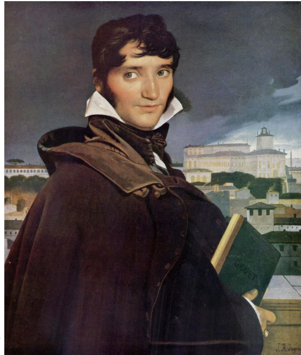
Ingres, ritratto di Granet, 1807