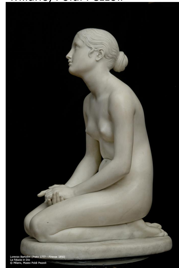
Lorenzo Bartolini (Prato 1777 - Firenze 1850) La Fiducia in Dio