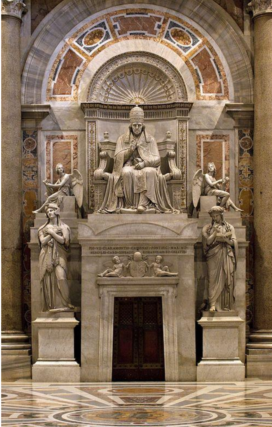
Tomba di Pio VII, 1823, San Pietro Cappella Clementina