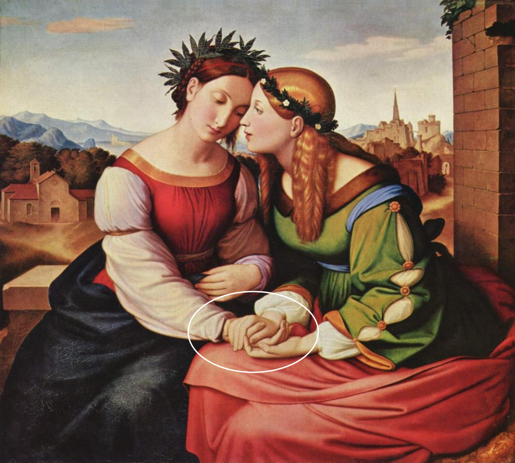
PURISMO, confronti tra Overbeck (Italia e Germania) e Lorenzo Bartolini (la Fiducia in Dio)