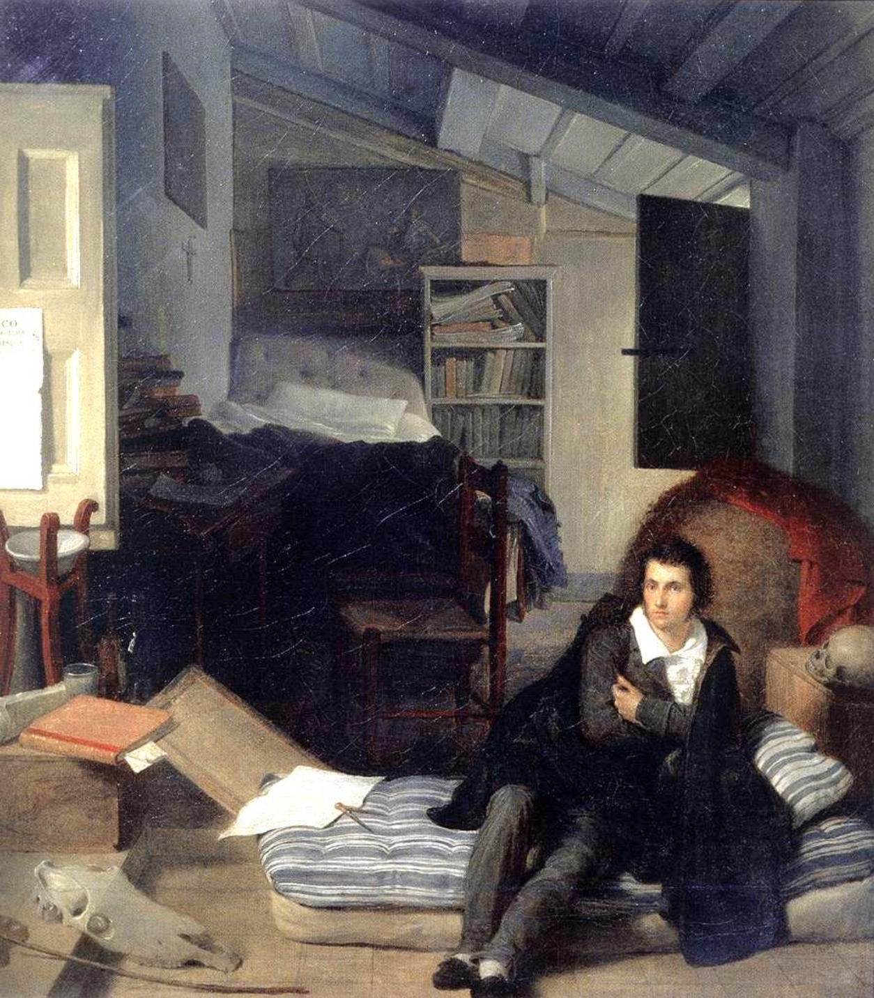
Tommaso Minardi, autoritratto nella soffitta, 1803, 37x33. Firenze, GAM, Pal. Pitti