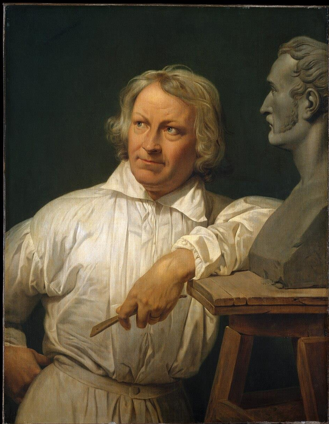
Horace Vernet, Ritratto di Berthel Thorvaldsen con il busto di Vernet, 1833, 96,5x75. Copenhagen, Thorvaldsen M.