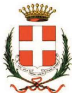
Comune di Asti