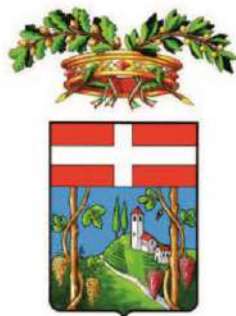
Provincia di Asti