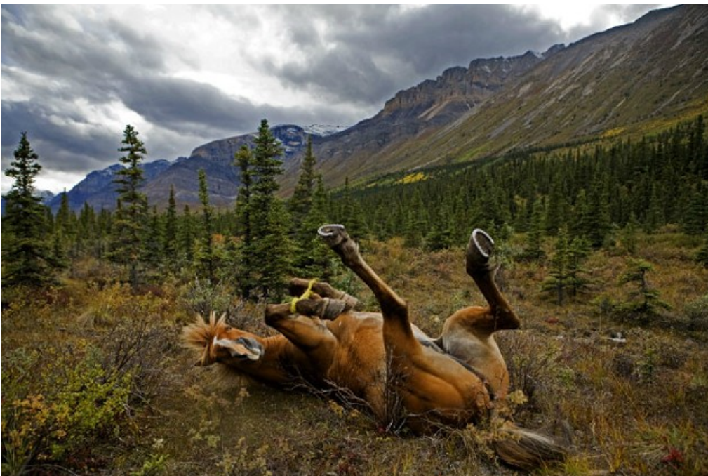
Dal lavoro Muskwa-Kechika, British Columbia, Canada