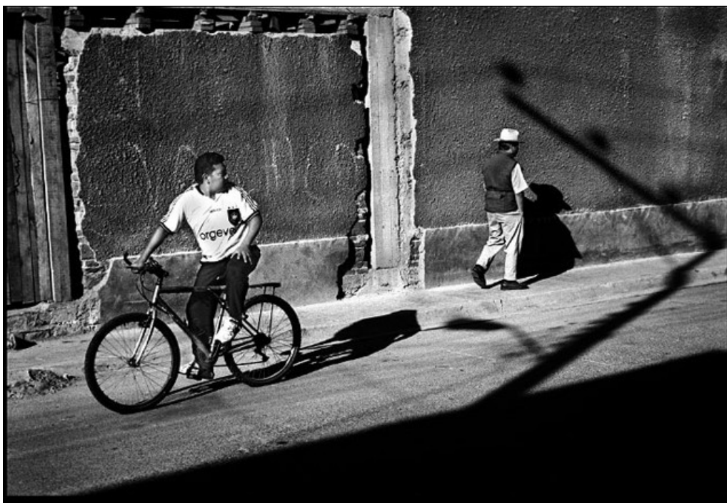
Dal lavoro Mexican Streets , Messico, ©Michael Christopher Brown, 2001

Fotografo decisamente eclettico, Michael Brown è passato attraverso il bianco e nero, la street photography, la documentazione sociale, la fotografia naturalistica e la fotografia di guerra (in questo post alcuni esempi dell'evoluzione del suo lavoro nel corso degli anni), distinguendosi nel lungo periodo per la sua serietà professionale, la brillantezza della sua visione fotografica, il suo stile compositivo molto grafico ed efficace e per una predisposizione e un'apertura innate verso stili e tecnologie alternative nel fotogiornalismo.