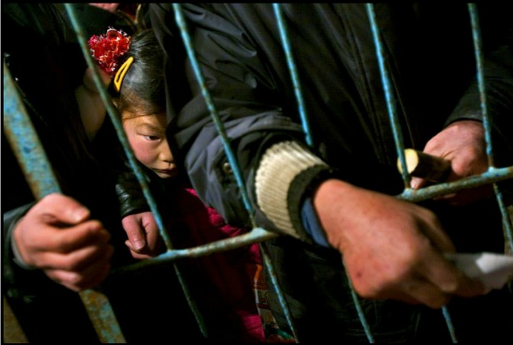
Dal lavoro Traveling Circus, Cina