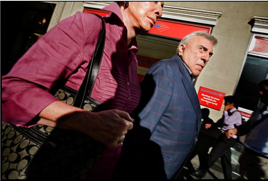
Dal lavoro Broadway , New York, USA, ©Michael Christopher Brown, 2009

2011. Viaggiando nei treni dei pendolari di Pechino, racconta, ha capito che per documentare quella moltitudine in maniera spontanea doveva avvicinarsi molto, e l'unico strumento per farlo era il telefonino." [...] Il cellulare mi permette di rendermi davvero invisibile, e di avvicinarmi alle persone come nessuna macchina fotografica [...] forse cambierà presto, ma almeno per ora, la gente non si rende bene conto che la stai fotografando, o non ti prende sul serio come fotografo..." Poco dopo, fotografando il conflitto in Libia, gli si è rotta la macchina fotografica, allora ha pensato, che cavolo, continuo a lavorare con l'iPhone... Il risultato è uno dei prmissimi reportage di guerra pubblicati sulla stampa internazionale realizzati interamente con un cellulare.