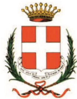
Comune di Asti