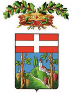
Provincia di Asti