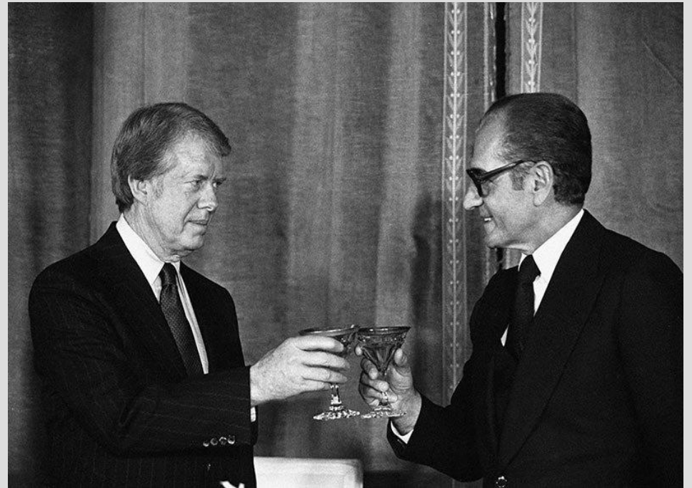
Carter e lo Shah

• Lo Shah, già malato di cancro, esitò a reagire anche perché il nuovo presidente USA, Carter, era favorevole ad un nuovo corso tollerante e riformista.