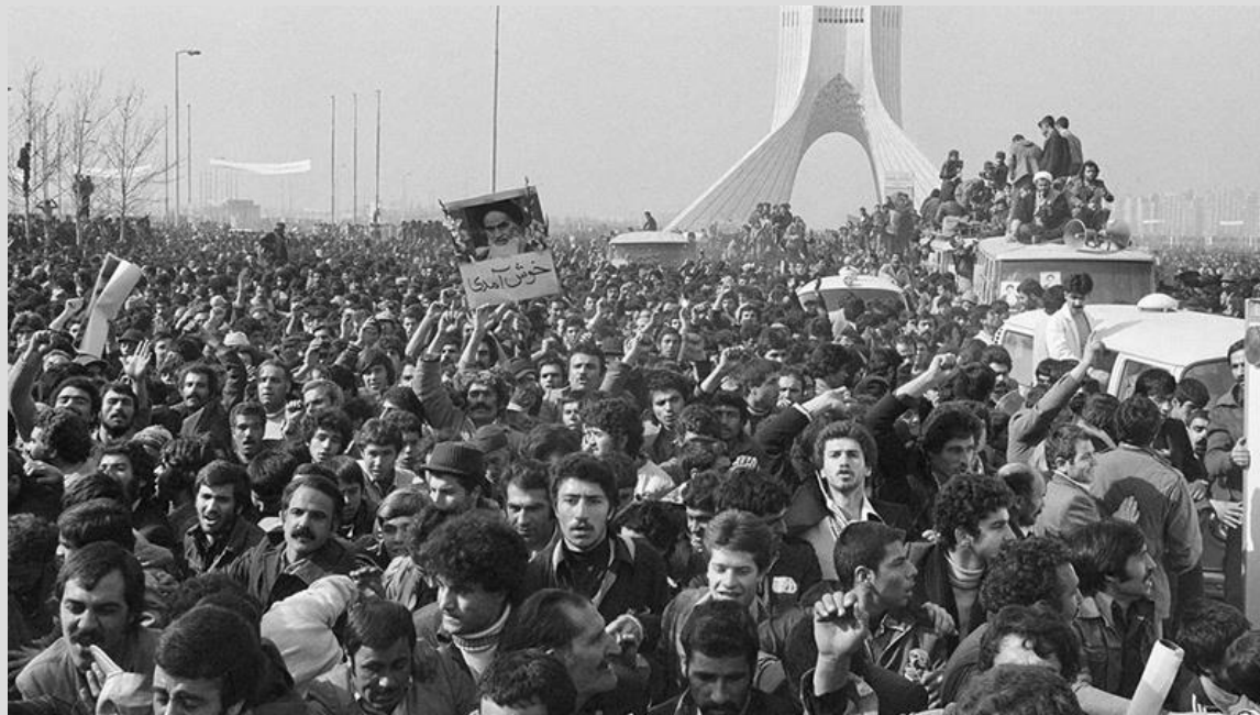
La folla a Teheran