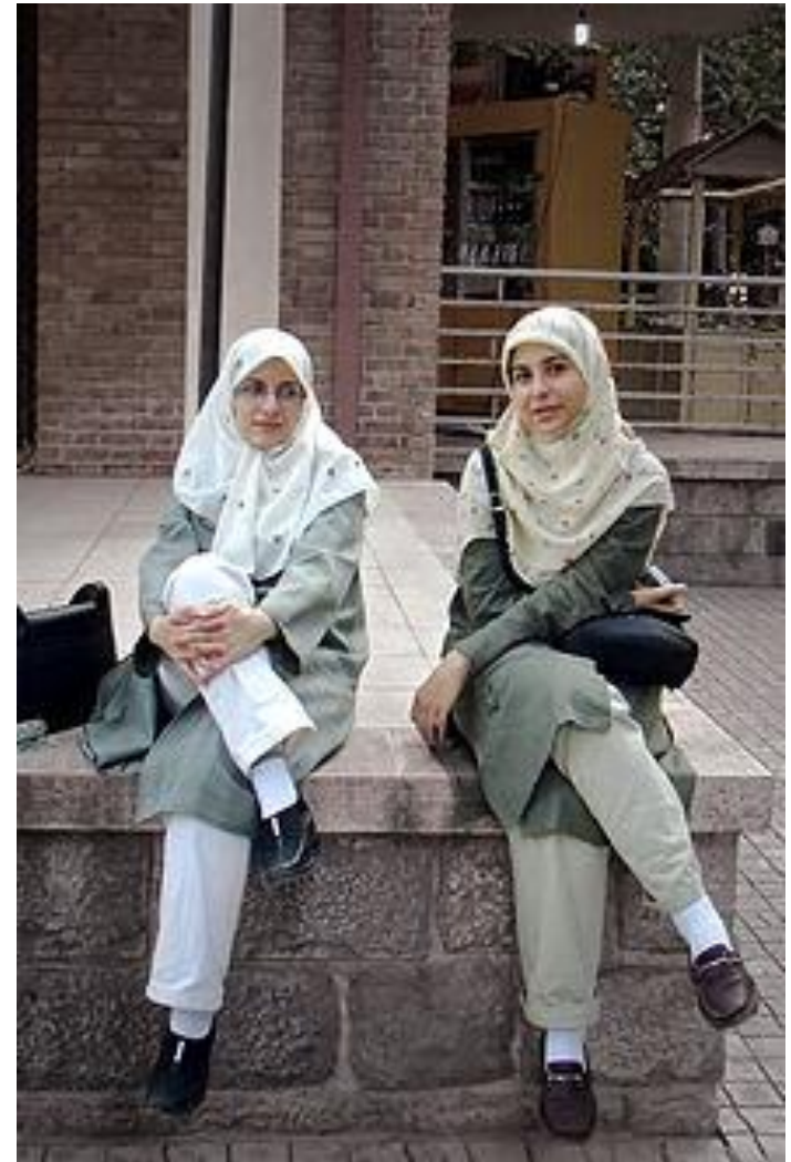
Donne iraniane 2009

.Fu reintrodotta anche l'istituto delle spose temporanee