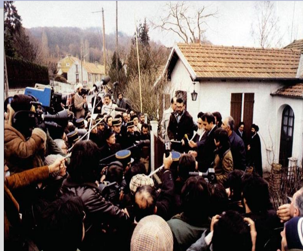
Khomeini davanti alla villetta alla periferia di Pa