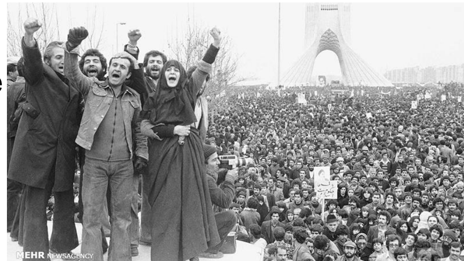
Manifestanti del Tudeh esultano a Teheran

1981 Uccisi circa 5.000 mujaheddin (filocomunisti).