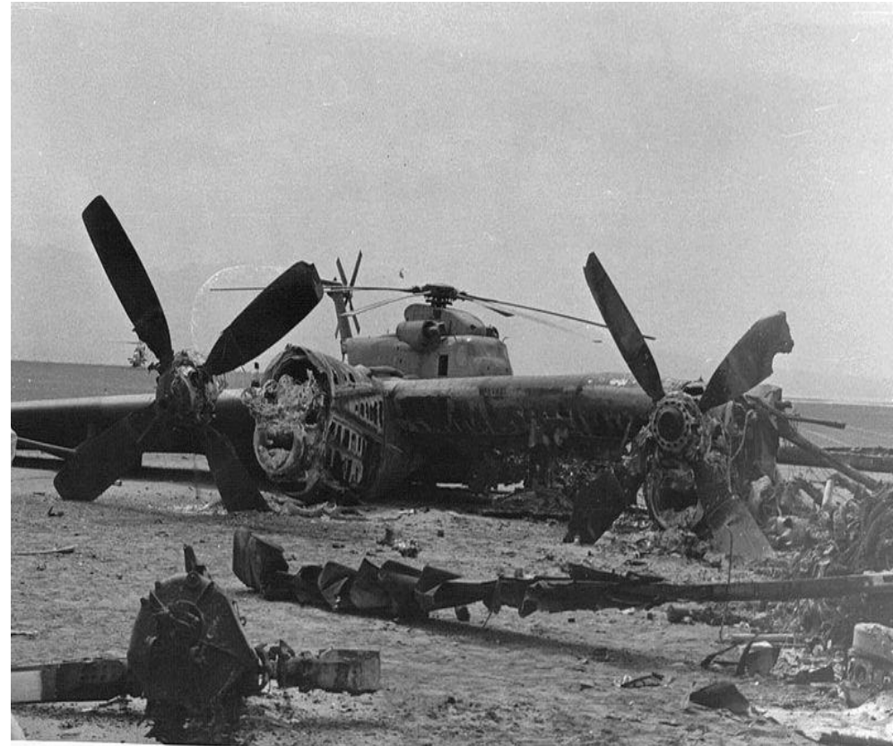
Aprile 1980 rottami di aereo USA distrutto nel