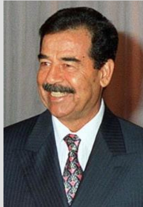
SADDAM HUSSEIN (1937-2006)