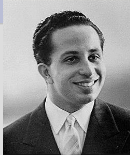
FAYSAL II (1935/58)