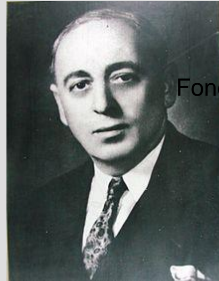
Zaki al Arsuzi 1899-1968

.Andrà al potere anche in Siria con Assad.