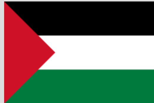
Bandiera del partito