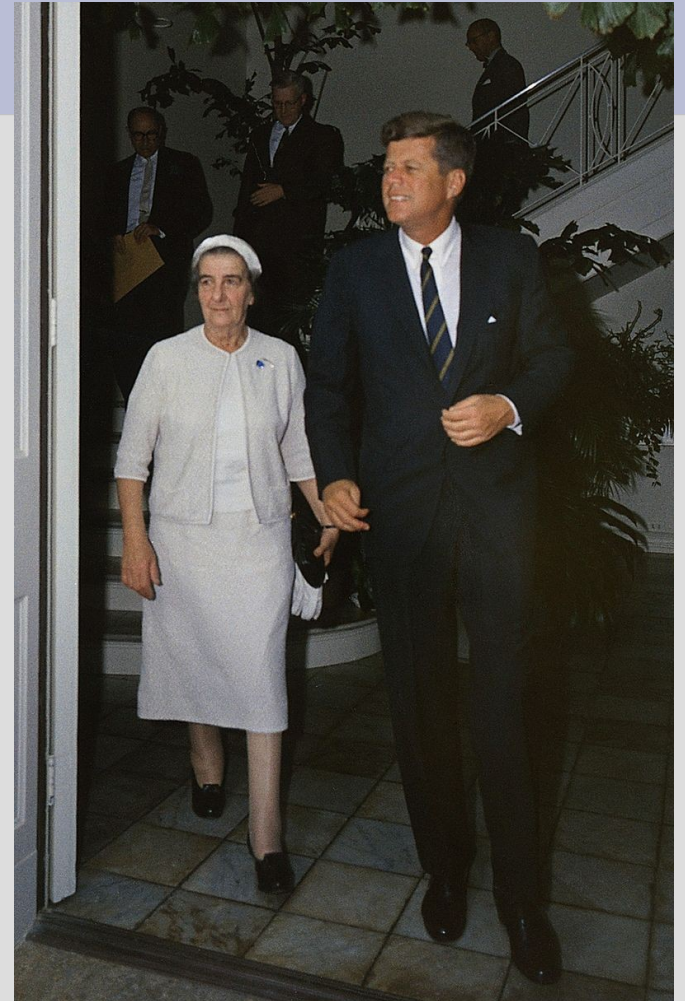
Golda Meyer (1898-1978) Qui con il presidente Kennedy Laburista fu primo ministro di Israele dal 1969 al 1974.