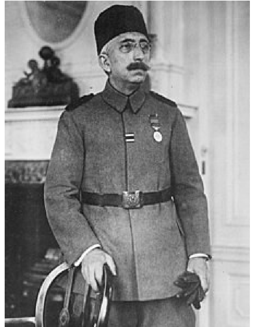
Maometto VI (1861-1926) Fino al 1922 sultano, califfo e imperatore dei Romani