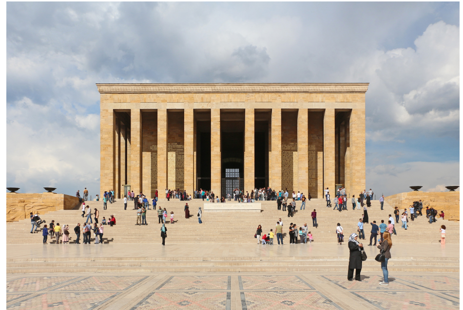
Mausoleo di Ataturk ad Ankara Inaugurato nel 1953.