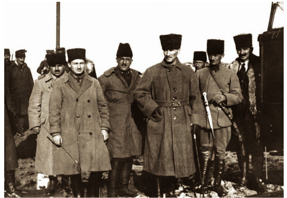
Mustafà Kemal nel 1920