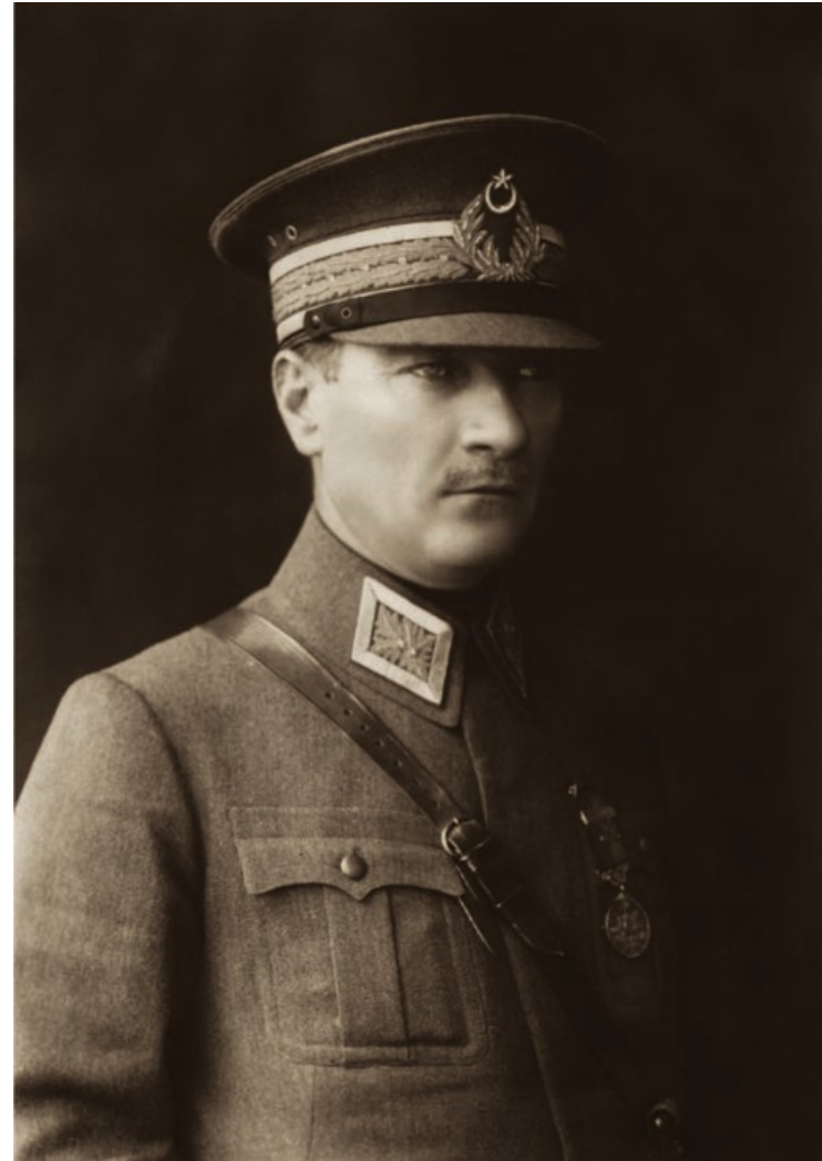
Kemal nel 1925