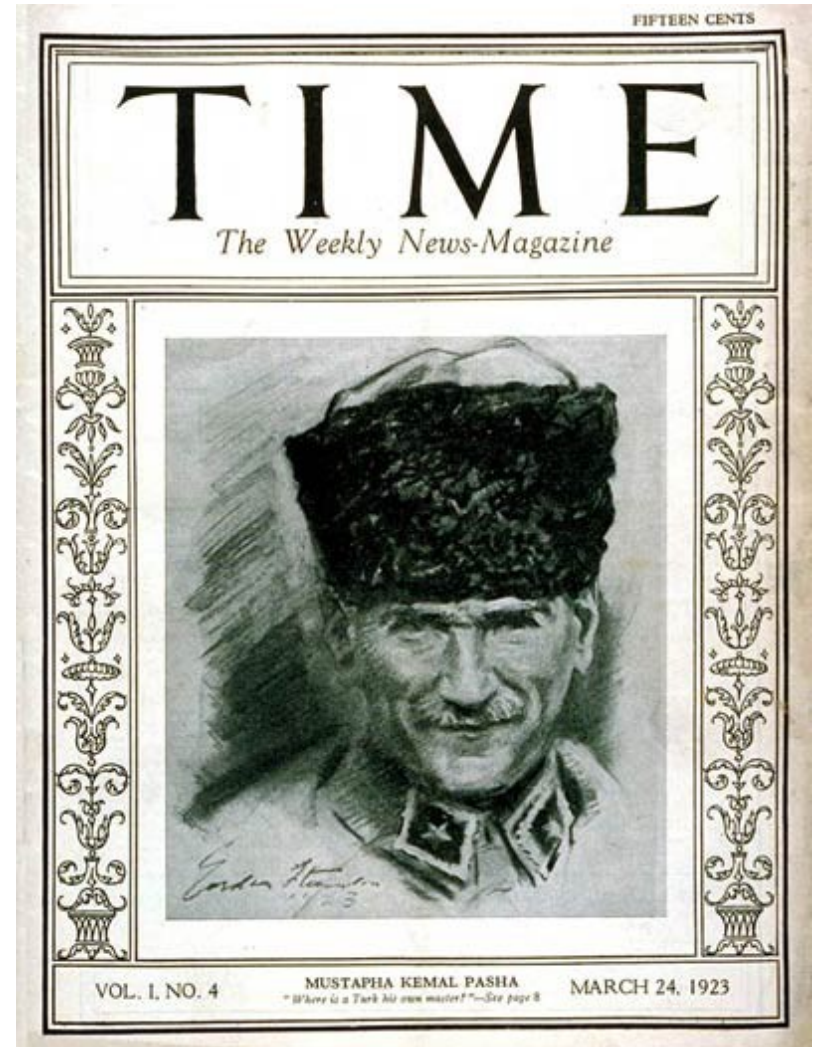
Copertina di Time dedicata a Kemal nel 1923