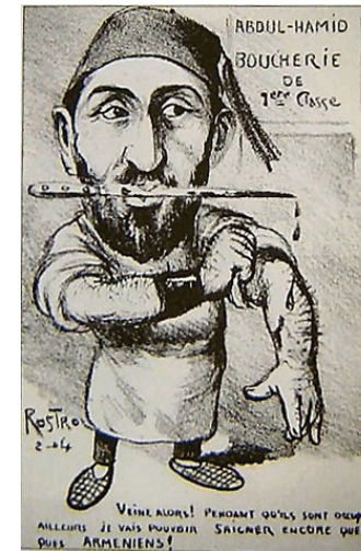
Abdulhamid II Il macellaio Vignetta satirica francese