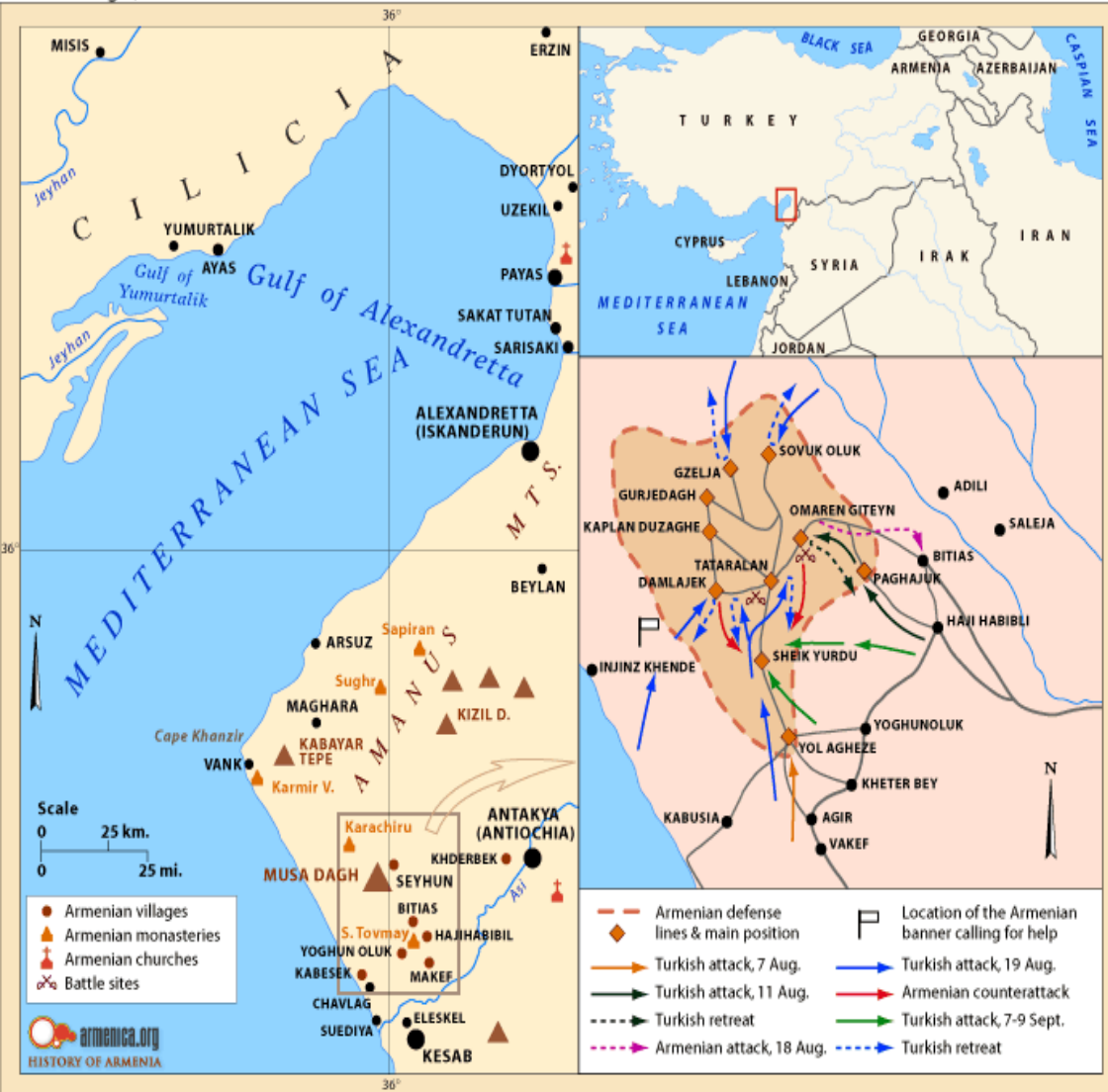
Musa Dagh, Scene of the Famed Armenian Self-Defense