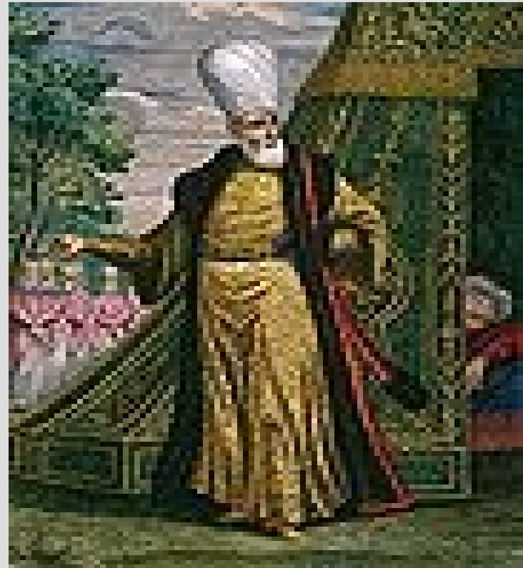
Aga (capo) dei Giannizzeri Fine XVIII secolo

.1826 Mahmud II massacra i giannizzeri e riesce a formare un esercito su modello europeo.