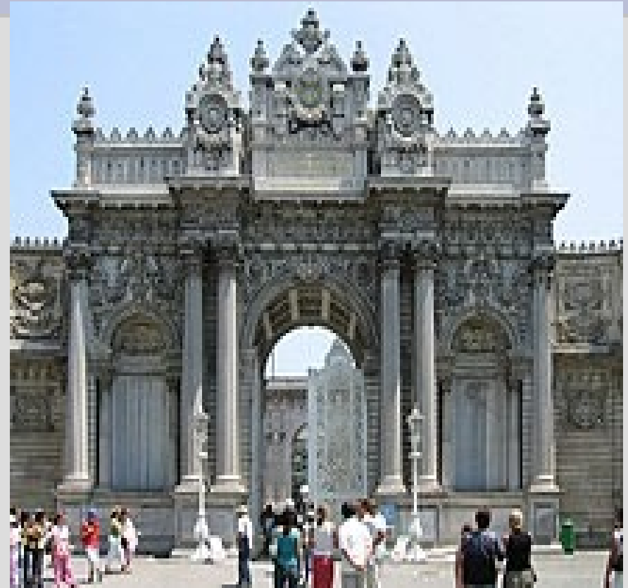
Palazzo Dolmabahçe a Istanbul. Il primo in stile europeo, fatto costruire da A